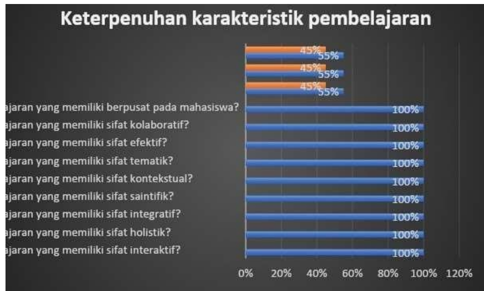
Gambar 1. Hasil Kuisisioner

Perolehan respon dosen Prodi S1 Perbankan Syariah pada Monev keterpenuhan karakteristik pembelajaran dan integrasi penelitian dan PkM dalam pembelajaran ditunjukkan pada Gambar 1.