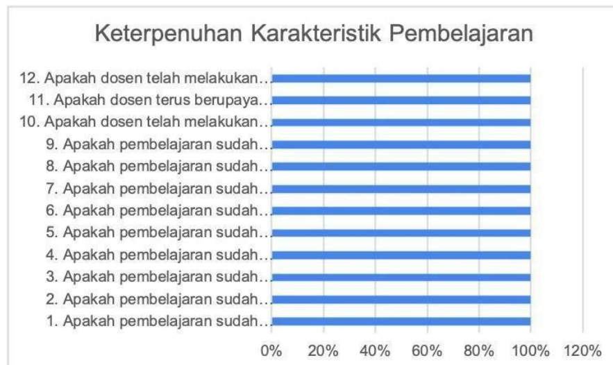
Gambar 1. Hasil Kuisisioner

Perolehan respon dosen Prodi Ekonomi Syariah Program Sarjana pada Monev keterpenuhan karakteristik pembelajarn dan integrasi penelitian dan PkM dalam pembelajaran ditunjukkan pada Gambar 1.