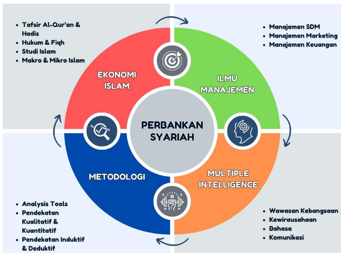
Gambar 1. Body of Knowledge